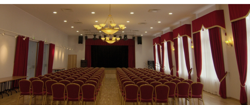
Birštono kultūros centras ir visi renginiai Birštone atšaukti