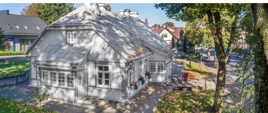
Birštono sakralinis muziejus