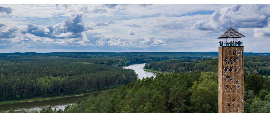
Birštono / Nemuno kilpų apžvalgos bokštas