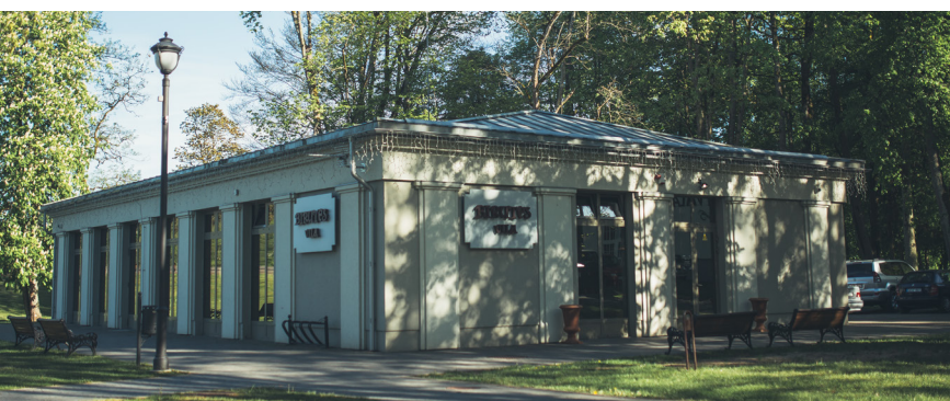
„Birutės vila“ mineralinio vandens paviljonas

Nuo kovo 16 d., visoje Lietuvoje paskelbus karantiną, laikinai uždaryti Birštono turizmo objektai, sveikatinimo, kultūros objektai: Birštono/Nemuno kilpų apžvalgos bokštas, mineralinio vandens paviljonas „Birutės vila“, Geltonoji biuvetė, Birštono muziejus, Birštono sakralinis muziejus. Visi renginiai atšaukti, veikla laikinai sustabdyta Birštono kultūros centre, Kurhauze.